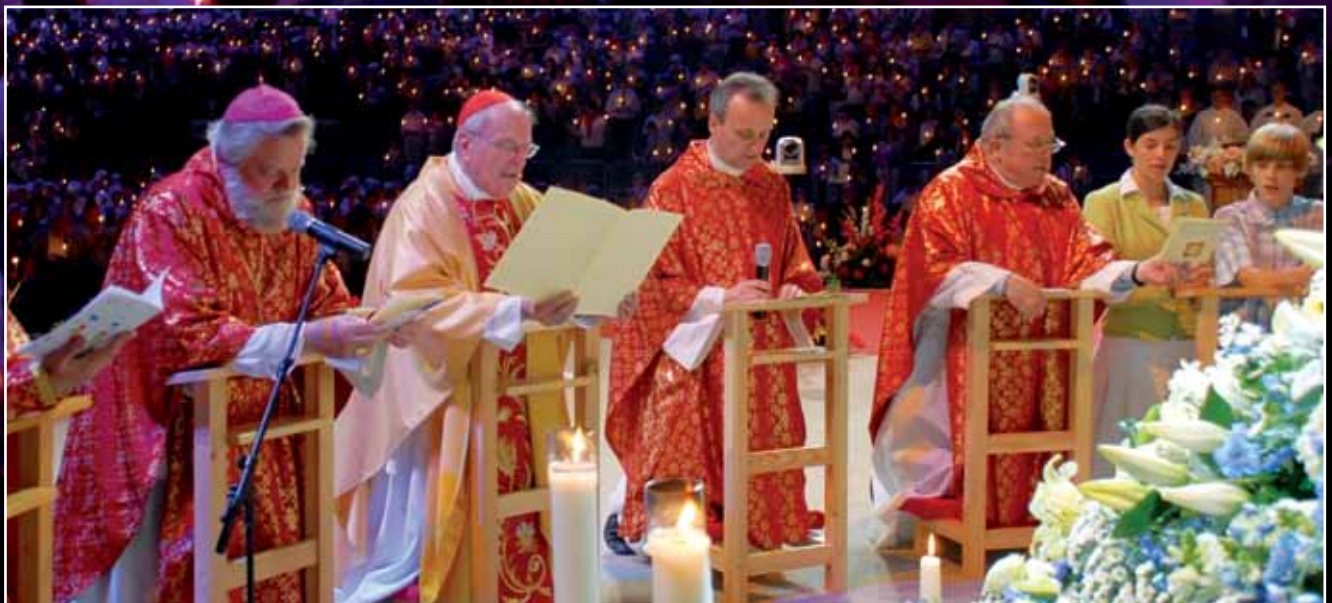
Во время Дня молитвы в Кёльне 31 мая 2009 г. Его Высокопреосвященство кардинал Иоахим Майснер, Его Высокопреосвященство Иосиф М. Пюнт, все священники и все присутствующие верующие в конце торжественной Св. Мессы Пятидесятницы прочли молитву посвящения, которой Папа Иоанн Павел II 25 марта 1984 г. на площади Св. Петра посвятил мир Непорочному Сердцу Девы Марии.