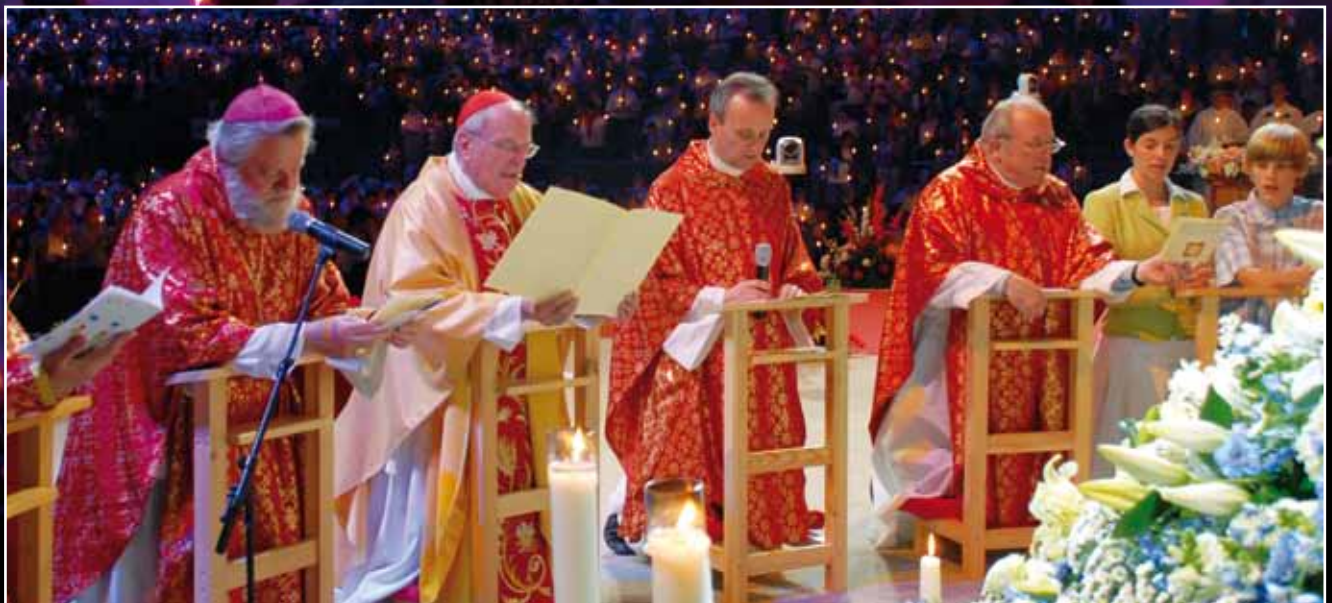
A kölni Imanapon 2009. május 31-én a pünkösdi szentmise végén Őeminenciája Joachim Meisner bíboros és Őexcelenciája Jozef M. Punt az összes jelenlévő pappal és hívővel együtt elimádkozták azt az imádságot, mellyel II. János Pál pápa 1984. március 25-én a római Szent Péter téren a világot Szűz Mária Szeplőtelen Szívének szentelte.