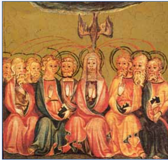
A pünkösdi csoda – Kölni mesterek, 1350 körül