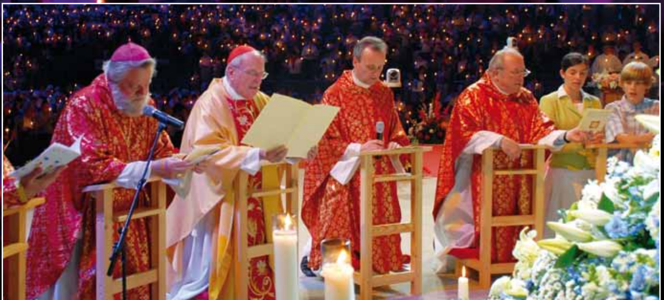
Během Modlitebního dne v Kolíně 31. května 2009 se Jeho eminence kardinál Joachim Meisner, Jeho excelence Jozef M. Punt, všichni kněží a přítomní věřící na konci svatodušní mše svaté pomodlili modlitbu zasvěcení, kterou papež Jan Pavel II. 25. března 1984 na Svatopetrském náměstí v Římě zasvětil svět Neposkvěnému Srdci Panny Marie.