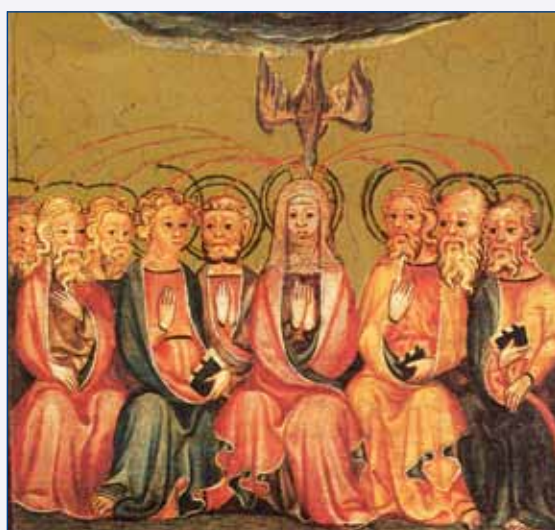
Zázrak Sesláni Ducha svatého – Kolínský mistr r. 1350

„DOBŘE POCHOP NÁSLEDUJÍCÍ SLOVA: MATKA VŠECH NÁRODŮ MŮŽE UDĚLIT A UDĚLÍ MILOST, VYKOUPENÍ A POKOJ VŠEM NÁRODŮM TOHOTO SVĚTA, KTERÉ JI O TO PROSÍ. AVŠAK VY VŠICHNI MÁTE PŘINĚST M ATKU VŠECH N ÁRODŮ CELÉMU SVĚTU.“